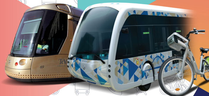
Illustration : Freepik